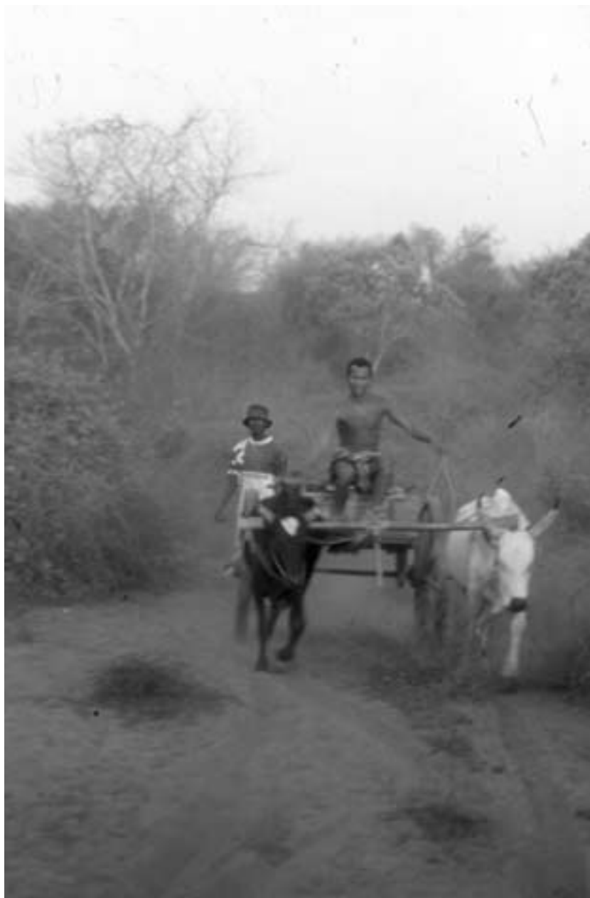
Oksene på bildet er ikke stjålet.

Denne solskinnshistorien er også omfavnet av gassiske myndigheter, som riktig nok har mange fine planer for hvordan de skal verne den helt særegne naturen på øya, men