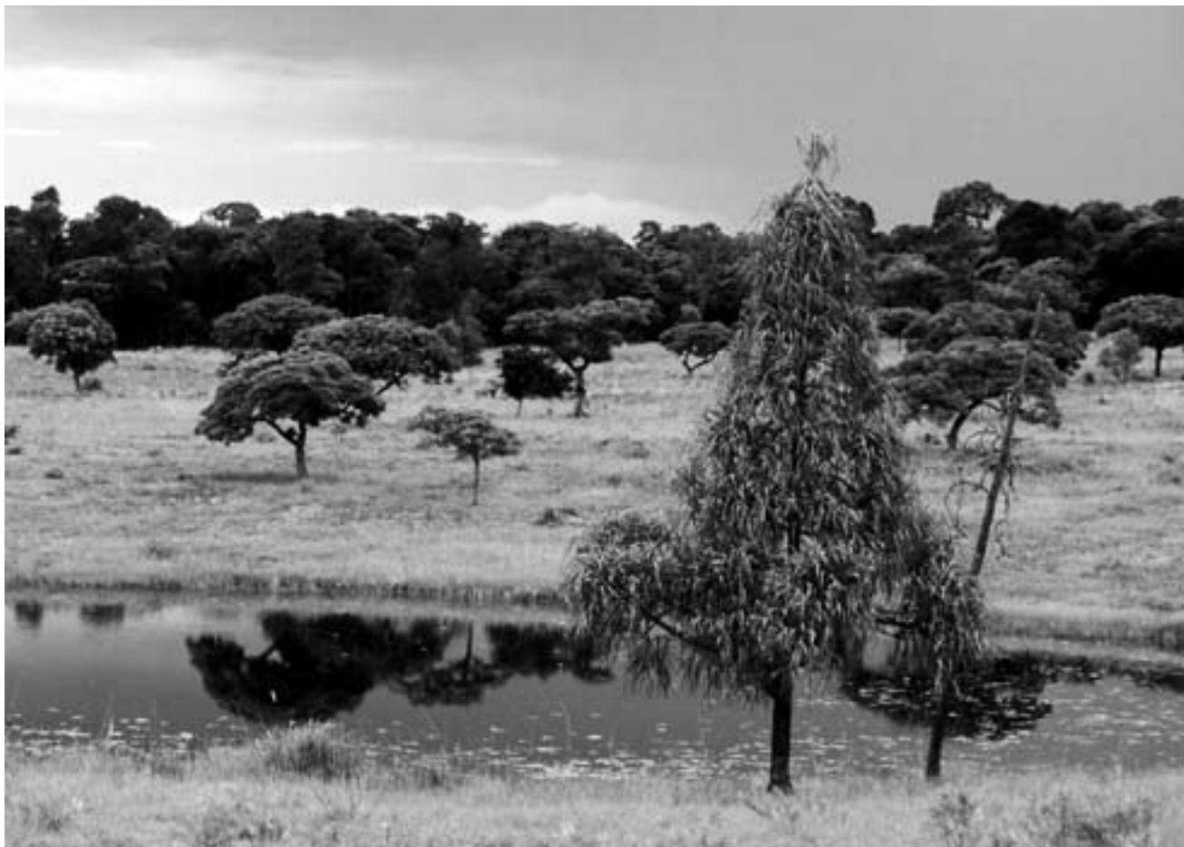
Zombitse Nasjonalpark med Vohibasia-skogen i bakgrunnen