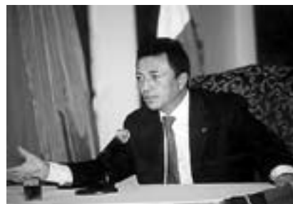
President Marc Ravalomanana

Da Marc Ravalomanana stilte som presidentkandidat, hadde han vært borgermester i Antananarivo i to år. Det var nok til å vise at det var mulig å rydde opp i et somlete og ineffektivt byråkrati. Marc fikk fart på renovasjonsvesenet i byen. Gatene ble feid, og søppel kjørt bort. Det er slike ting som vanlige folk legger merke til. Som borgermester viste han sin interesse