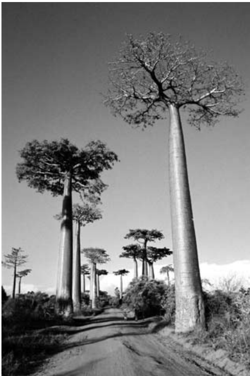
Allé med baobab ved Morondava.

• Utdanning og helse i området er støttet gjennom bygging av nye skoler og landsbyapoteker. Flere uavhengige evalueringsrapporter