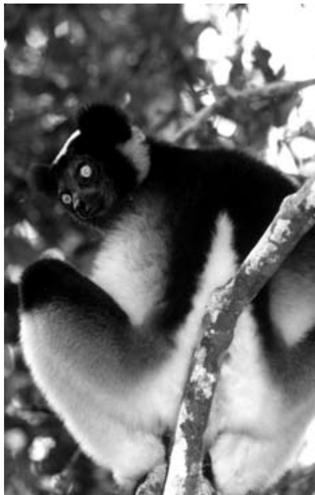
Indri i Perinét Nasjonalpark, Madagaskar

På gassisk kalles indrien for Babakoto - "Kotos far". En legende forteller at en indri reddet gutten Koto fra rasende villbier, og etter gassisk skikk er en som redder en annen fra å dø å regne som mor eller far til den som ble reddet. I takknemlighet bestemte folk også at indriene skulle regnes som menneskenes venn og derfor skal den ikke jaktes på. Slik kan en legende være vel så viktig for naturvernet som en