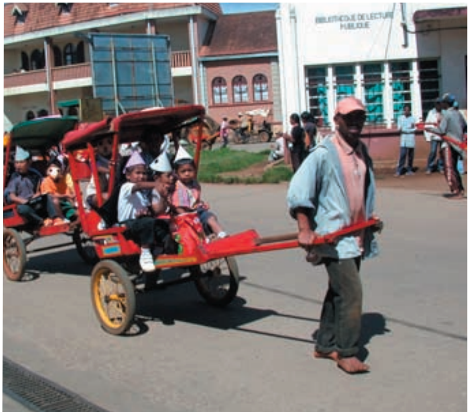
Skal Pousse skal snart bli innført til Stavanger som en del av samarbeidet?

Da var reisen slutt, selv om noen hadde andre planer. Men det hører hjemme i en annen sammenheng.