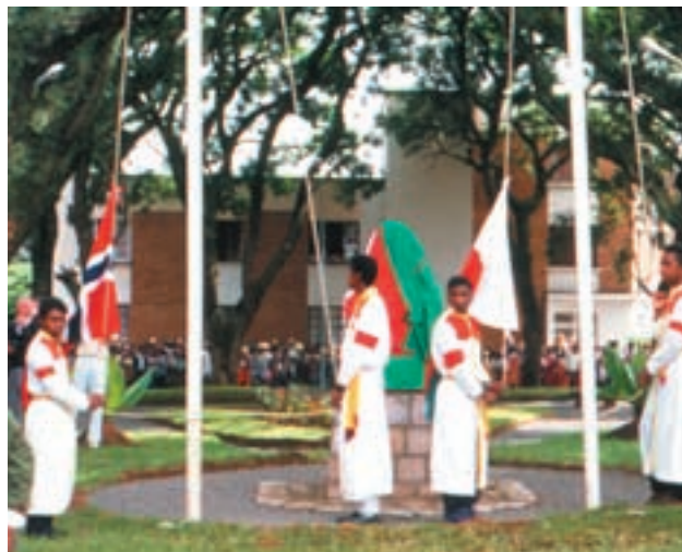
Det er flere norske og gassiske organisasjoner som samarbeider. Les om dem i de kommende utgaver av Maresaka .

Det er etablert et universitetssamarbeid mellom Universitetet i Antananarivo og Norges Teknisk-Naturvitenskapelig Universitetet (NTNU) i Trondheim når det gjelder samfunnsgeografi og botanikk. Universitetet i Bergen (Institutt for sosialantropologi) har en samarbeidsavtale med Universitetet i Antananarivo, nærmere bestemt Institut des Civilisations/Musée de