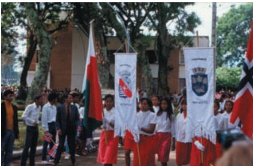
Kommunepolitikere fra Stavanger og Antsirabe i opptog.