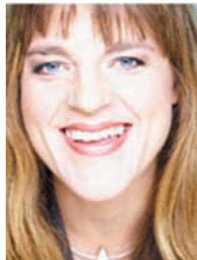
Utviklingsminister Hilde Frafjord Johnson erklærte 4. juni at Madagaskar vil få status som norsk samarbeidsland fra budsjettåret 2004.