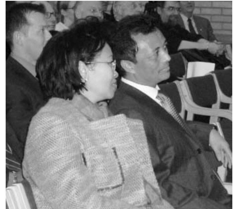
President Ravalomanana med frue

Viktigst for de mange tilreisende og gjester var nok allikevel kaffepausen – som gikk så altfor fort. Presidenten