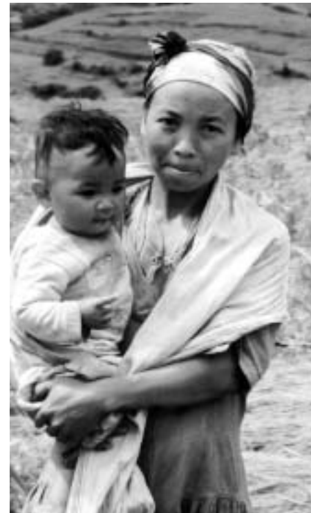
Lokal samarbeidspartner - Anjepy

SIKs visjon er å arbeide med forskning og fagutvikling innen interkulturell kommunikasjon, kulturforståelse og globalt samarbeid. Det faglige arbeidet tar utgangspunkt i det kulturelle mangfoldet i verden. Globaliseringsprosesser har skapt nye former for interkulturelle møter verden over.