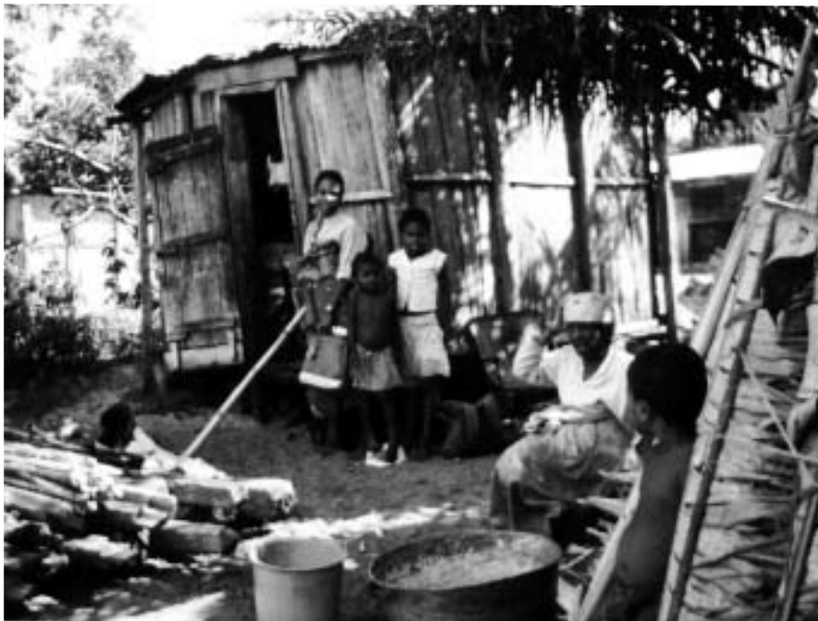
Midlertidig husvære etter sykklonens herjinger i Farafangana.

Madagaskars varme klima kan nok være en velsignelse for mange av landets fattige, som ikke har annet enn en stråhytte eller et bølgeblikktag som ly mot vær og vind. Snø, kulde, og forfrysninger er for de fleste gassere et ukjent begrep, og selv om en opplever tørkeperioder fra tid til annen, er landet skånet for de verste sult katastrofene som en til tider hører om på det afrikanske fastlandet. Men som så mange andre øynasjoner i tropiske farvann, slipper heller ikke Den Store Øya unna de tropiske sykklonenes ubarmhjertige herjinger. Og igjen, det er de dårligstilte det går verst ut over.