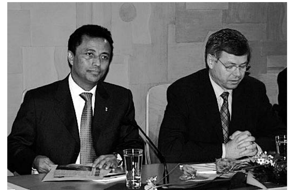
Ravalomanana og Bondevik på pressekonferansen i Oslo.