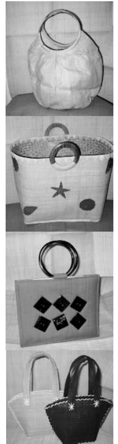
Noen av Sidonies produkter som er laget av det økologiske materialet rafia.

Nå håper jeg at ting vil fortsette å utvikle seg positivt fremover og jeg kommer til holde på med dette lenge.... for enhver dame bør jo fornye veske beholdningene sine hvert år!!