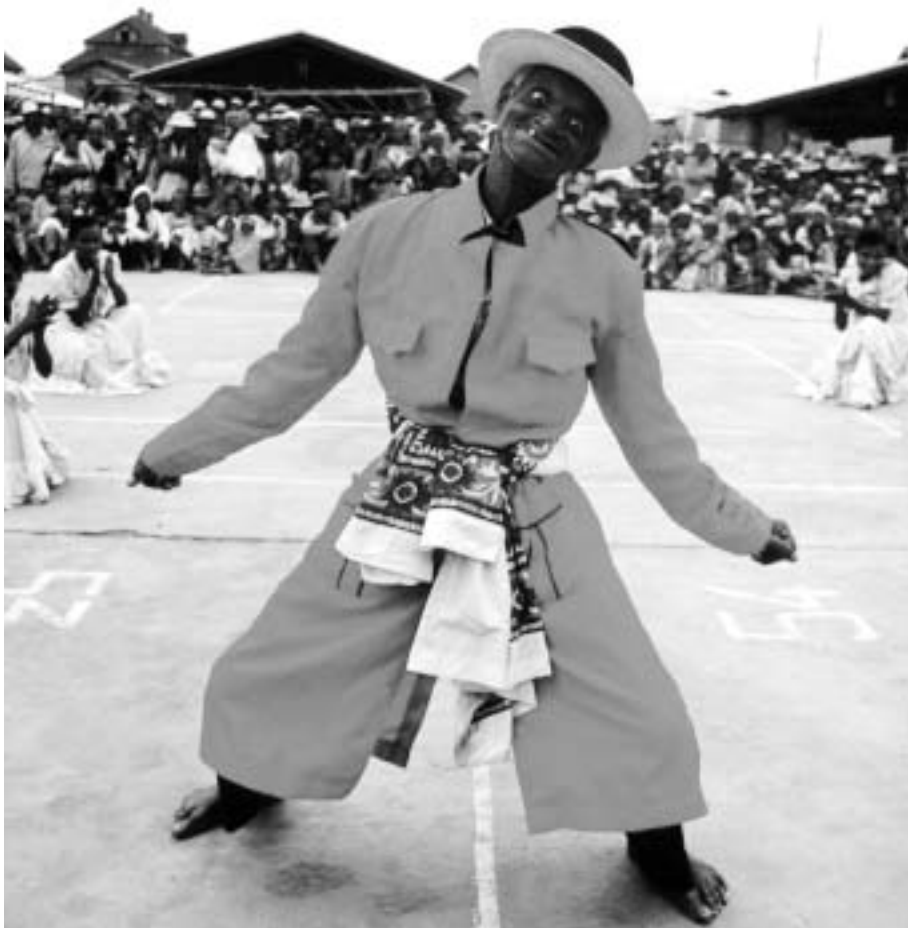
Hira gasy, folkedans, sang og teater brukes for å nå folk flest

finansieres av NORAD og ressursene brukes i hovedsak av ANAE til miljøinformasjons-tiltak, mens SIK har en viktig andel i prosjektet administrativt og forskningsmessig.