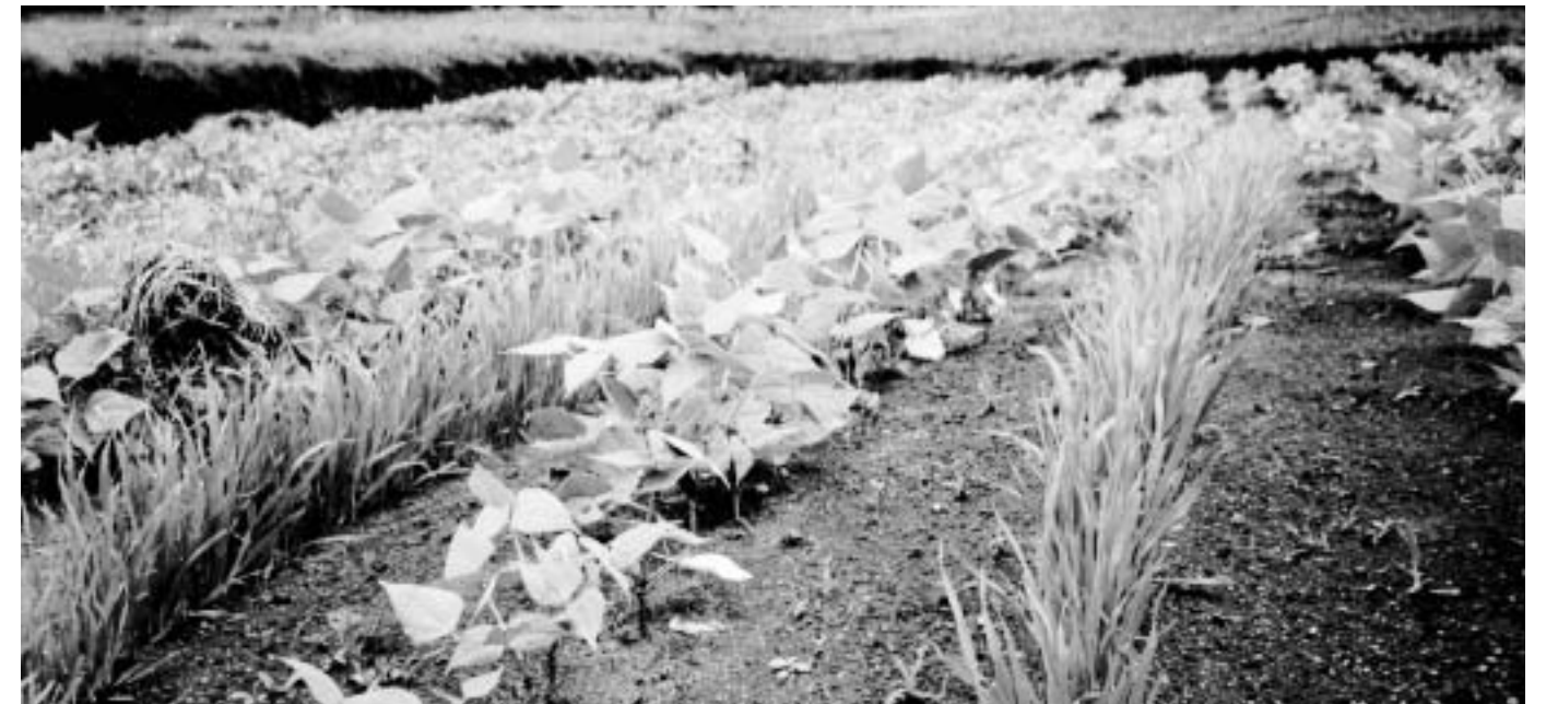
Samplanting, å plante to forskjellige vekster annenhver, er en måte å stoppe erosjon på.

Foruten spesialisering i fagområdene kulturforståelse og interkulturell kommunikasjon har SIKs stab profesjonsutdanning innen undervisning, psykologi og teologi. Yrkeserfaringen dette representerer gir et godt utgangspunkt for undervisning og utredningsarbeid innen temaområdet det flerkulturelle samfunnet. SIK arbeider som kursholdere, studieledere og konsulenter/utredere innenfor emner som kulturforståelse, flerkulturell kompetanse, religionsmøter og religionsdialog, migrasjonspedagogikk, flerkulturelt barnevern, antirasistisk holdningsarbeid, handlingsplaner for integrering, flerkulturell kompetanse i høyere utdanning, m.m. SIK arbeider i hovedsak på tre måter: gjennom forskning, undervisning / kurs og konsulenttjenester.