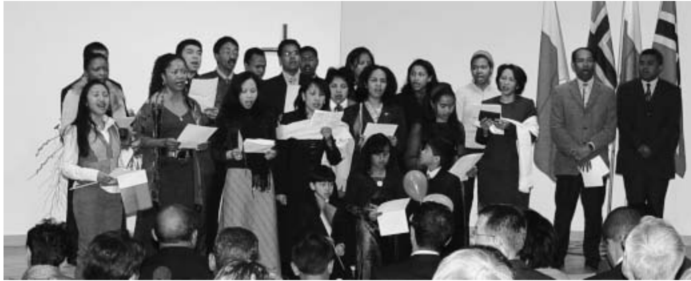
Fra møte på Misjonshøgskolen i Stavanger