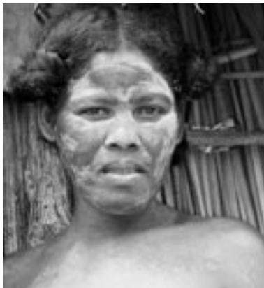
HUDPLEIE: Mangily-jentene bruker maske for å bleke huden.