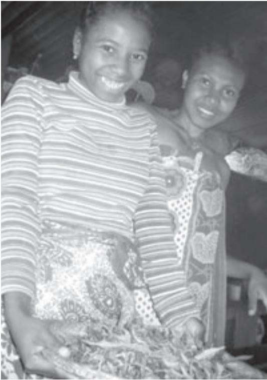
SOSIALT: Matlaging betyr samarbeid, som igjen betyr muligheter for å lære noe nytt.