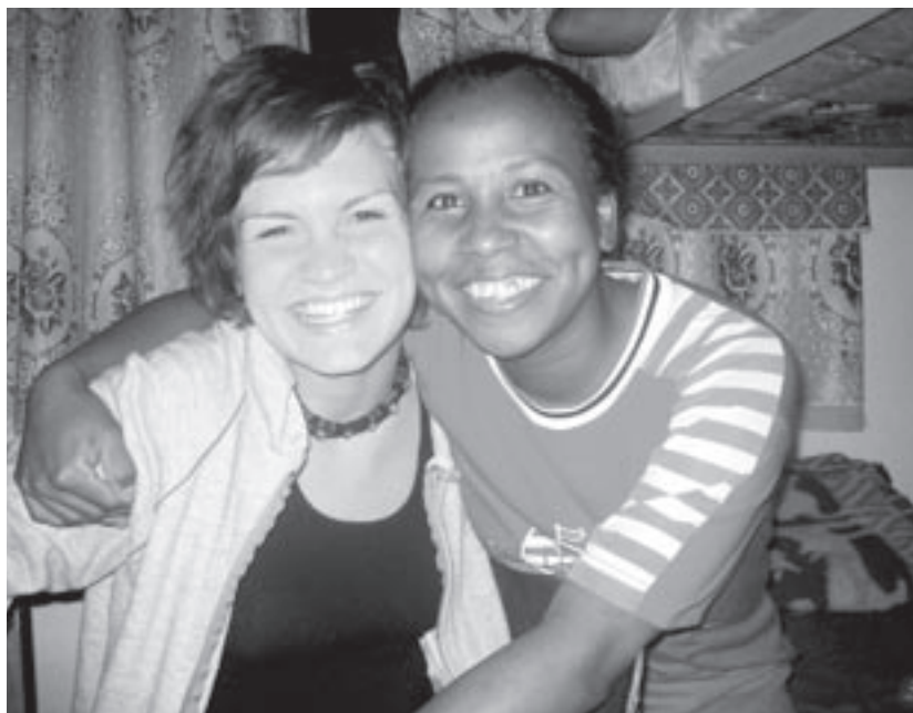
VENNER: Det er ikke noe problem å finne nye venner på den store øya!