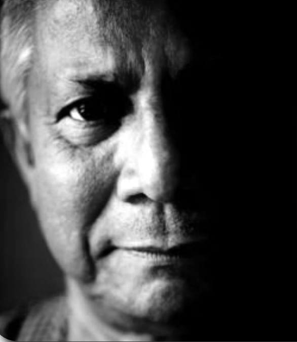
Mohammad Yunus, fredsprisvinner 2006.