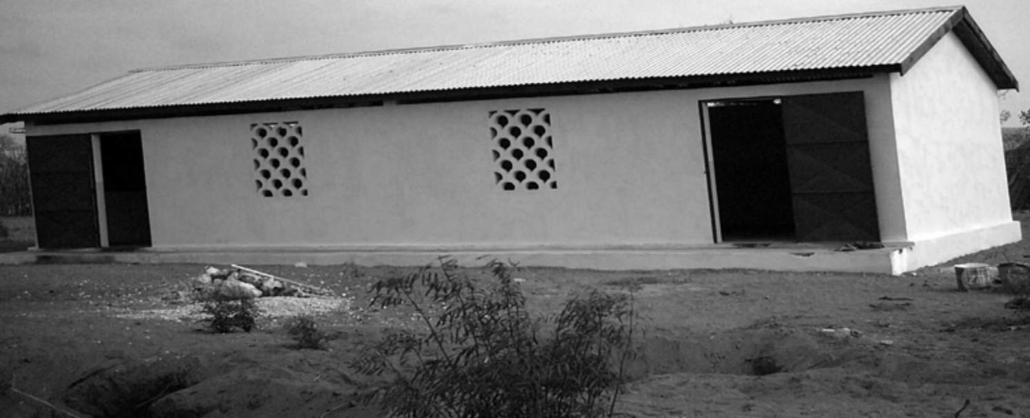
KLAR: i november 2006 sto ungdomsskolen i Ifaty-Mangily ferdig.