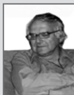
VÅR KORRESPONDENT I STAVANGER