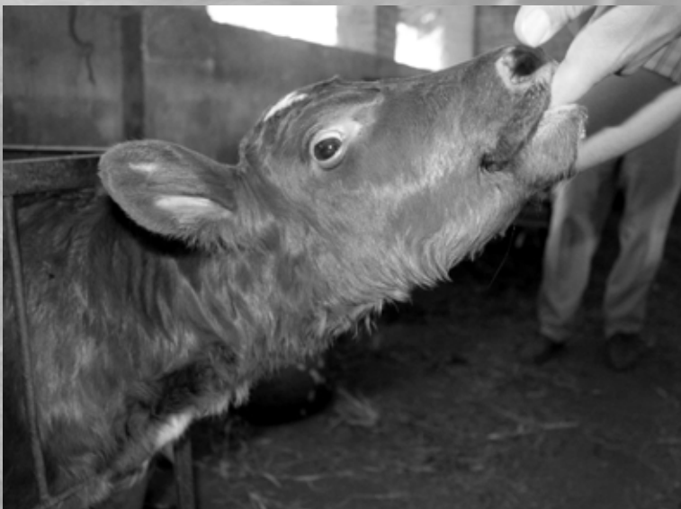
Det hersker nå en viss usikkerhet rundt fremtiden for Dagros på Madagaskar.

Det var NMS som først fikk NRF-kviger til landbruksskolen sin i 1965.