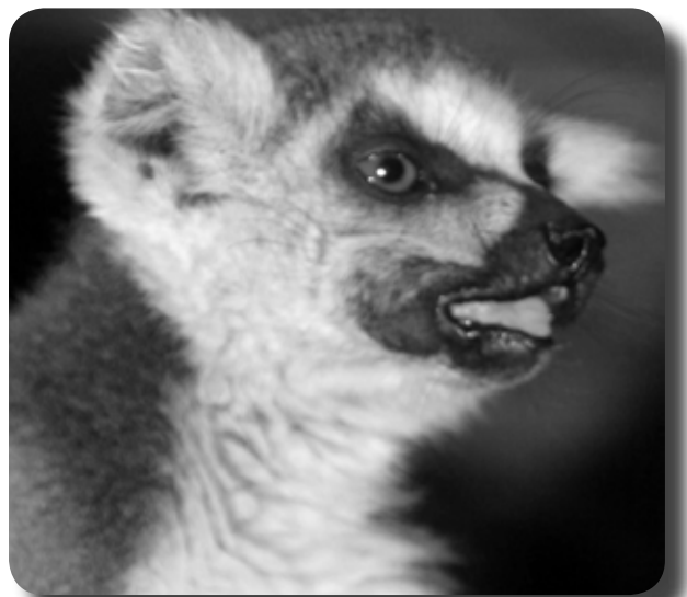
Bevaring av dyrene inngår i presidentens plan.