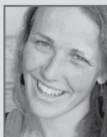
VÅR KORRESPONDENT I TRONDHEIM