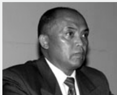
Charles Rabemananjara, statsminister og innenriksminister.

Charles Rabemananjara, statsminister og innenriksminister Marcel Ranjeva, utenriksminister Radavidason Andriamparany, finansminister Petera Behajaina, forsvarsminister Haja Nirina Razafinjatovo, utdanningsminister Harison Randriarimanana, økonomi- og planminister Jean Louis Robinson, helseminister Lala Ratsiharovalana, justisminister Donat Andriamahefaparany, gruveminister Roland Randriamampionona, arbeidsminister Koto Bernard, miljøminister Yvan Randriasandritriniony, desentraliseringsminister Bruno Andriantavison, telekommunikasjonsminister Laporte Ravelonahivo, turisme- og transportminister Jacky Tsiandopy, minister for offentlige tjenester Patrick Ramiamanana, energiminister Philémon Rabarison, minister for ungdom og sport Marius Ratolonjanahary, landbruksminister Cécile Manorohanta, viseminister for utdanning Harifidy Alin Jean Seth Ramilison, viseminister for landbruk Désiré Rasolofomanana, statssekretær for offentlig sikkerhet Herman Razafindravelo, statssekretær for kultur