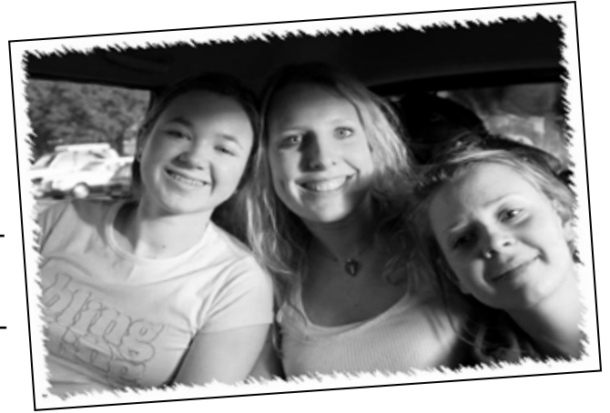
St. Olav-studenter på Madagaskartur

I 1989 reiste en delegasjon fra Stavanger kommune til Madagaskar og inngikk en venns­kapsbyavtale med Antsirabe kommune. Avta­len har senere ført til mange konkrete resulta­ter og venns­kapsbesøk for begge parter.