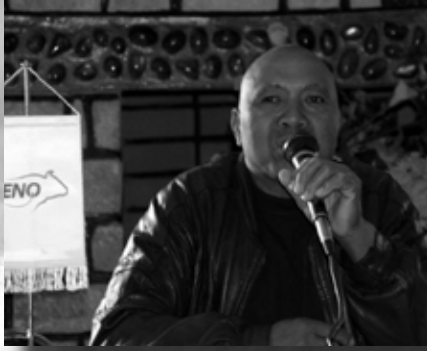
PNR møte i Antsirabe 2005