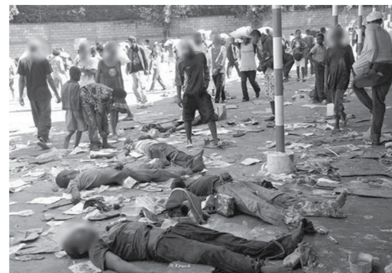
DØDE: - Flere personer døde etter brannen i magro.

Tirsdag 27. januar, startet rolig i Toliara. Vi passerte lageret til TIKO, presidentens meieri. Det var fem-seks uniformerte og bevæpnede vakter utenfor. Det begynte å gå opp for oss at noe var på gang da vi la merke til at mange butikker og internettkafeer var steng-