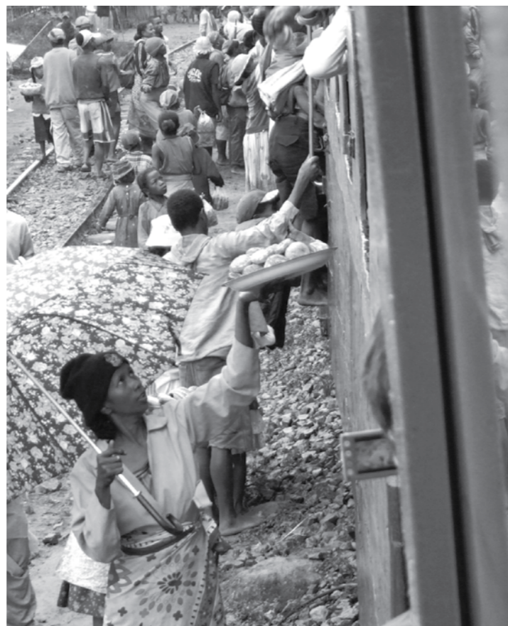
Når toget stopper, kommer selgerene med sine varer.

i stedet for å kontakte facebookvennene for å fortelle om våre viderverdigheter, rusler vi rundt og ser på folkelivet – og folkelivet ser på oss.