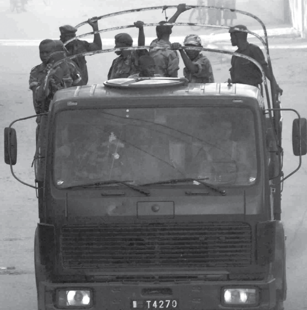
Militæret får betalt for å beskytte - noe de ifølge øyenvitner ikke gjorde da det trengtes.

TEKST: FREDSKORPS-FORSKER BIRGER VEUM