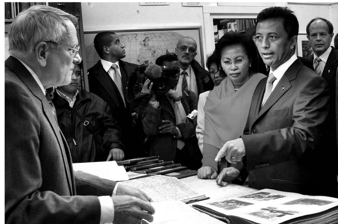
President Marc Ravalomanana med fru Lalao og resten av fylgjet som vitja NMS, arkivet og Stavanger i 2004.