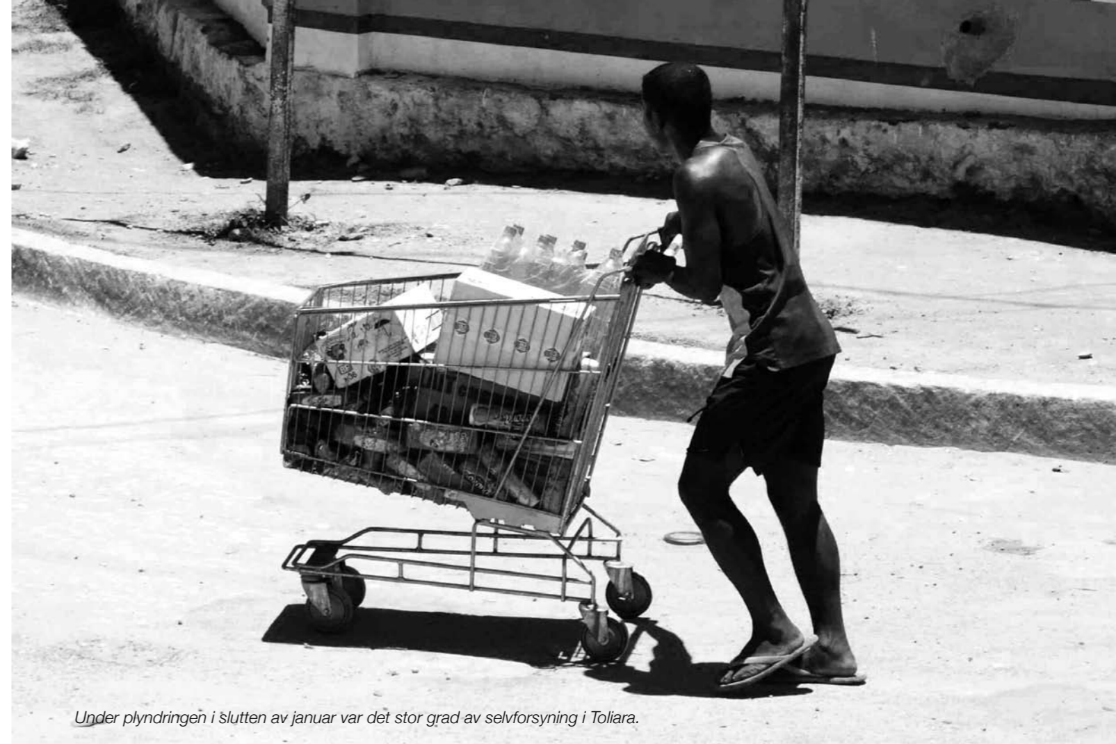
Under plyndringen i slutten av januar var det stor grad av selvforsyning i Toliara.

Men han har tro på at Courts kommer seg på beina igjen. De ble hardt rammet av opprøret, men ikke helt knekt.