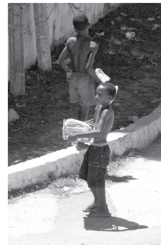
Både barn og voksne benyttet seg av muligheten til gratis ris.

te. Da vi kjørte forbi Toliaras eneste supermarked Magro, som også er eid av presidenten, var det til vår overraskelse bare de to sedvanlige uniformerte vaktene som lå henslengt foran bygningen. Vi fant en åpen internettkafe, og meldte hjem om fred og ingen fare i Toliara, selv om vi fikk en gryende følelse at noe var på gang. Vi brøt opp før vi hadde tenkt, og kom oss hjem.