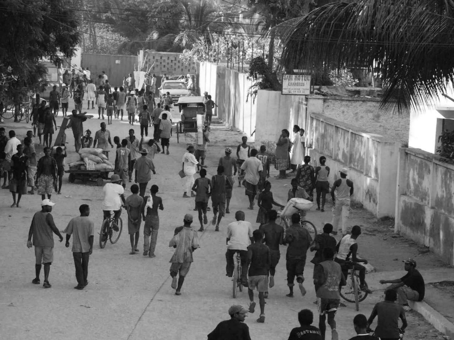
Gatene full av folk i Toliara.

Jeg har stor forståelse for at ordensmakten viser forsiktighet med å bruke makt i slike situasjoner, men samtidig er det skremmende å se at staten overhodet ikke oppfyller sin viktigste oppgave - det å beskytte sine innbyggere mot overgrep. Hvordan skal utenlandske bedrifter kunne investere i et slikt klima?