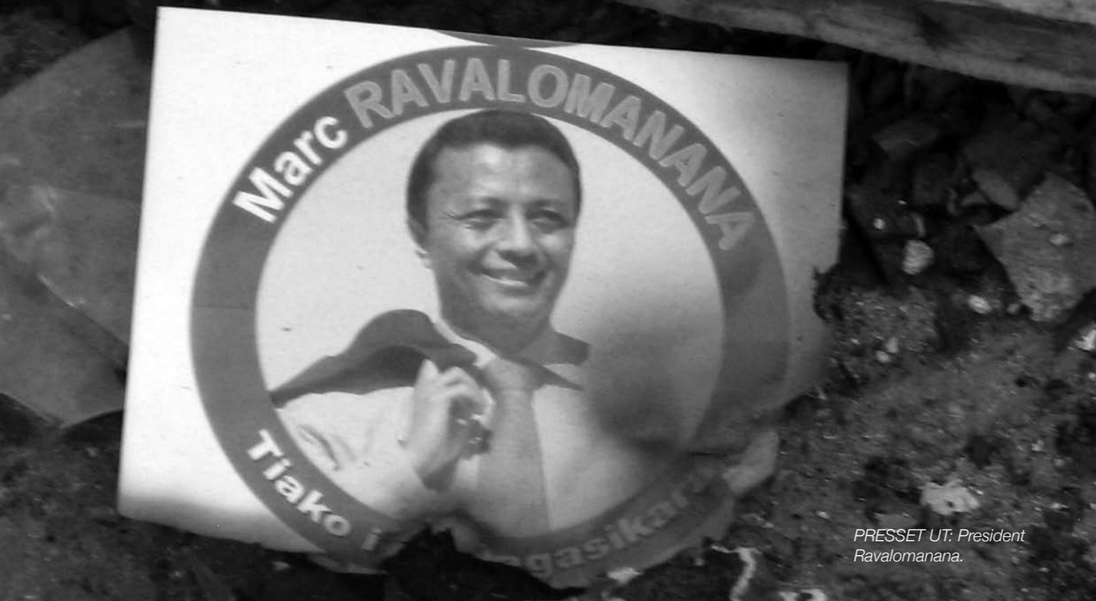
PRESSET UT: President Ravalomanana.