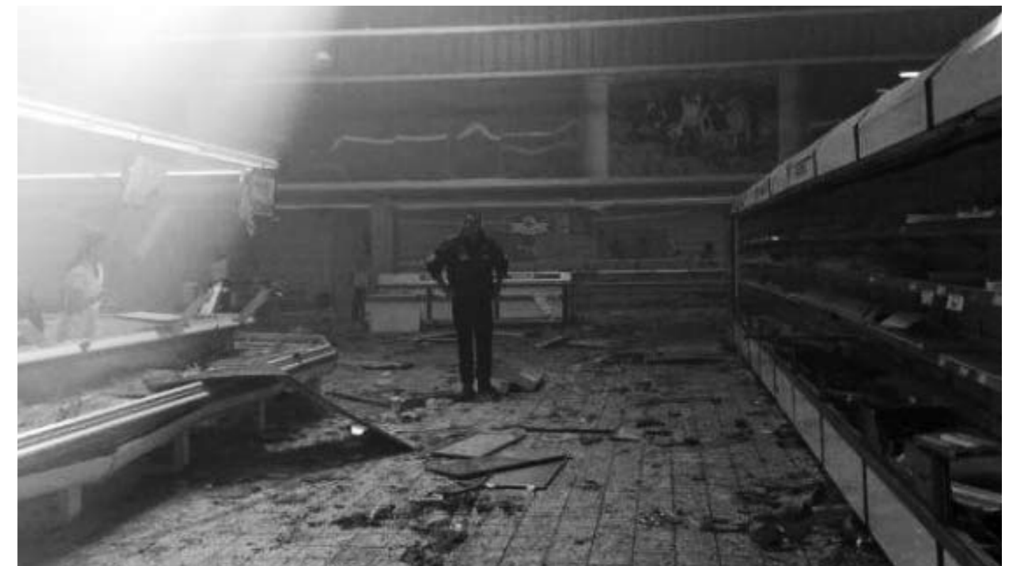
Ikke mye igjen av butikken...

Det er ikke så mange av dem jeg kjenner som vet at jeg er en av robberne. Når jeg snakker med venner, tør jeg ikke å si noe før jeg vet at den andre også var med. Men jeg er ikke stolt av det jeg gjorde. Ja, jeg angrer virkelig på at jeg var med. Jeg ser at alt er ødelagt etter oss, og at alt som er igjen er søppel. Hele byen er jo full av søppel etter oss, men ingen orker å rydde opp.