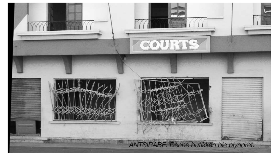
ANTSIIRABE: Denne butikken ble plyndret.