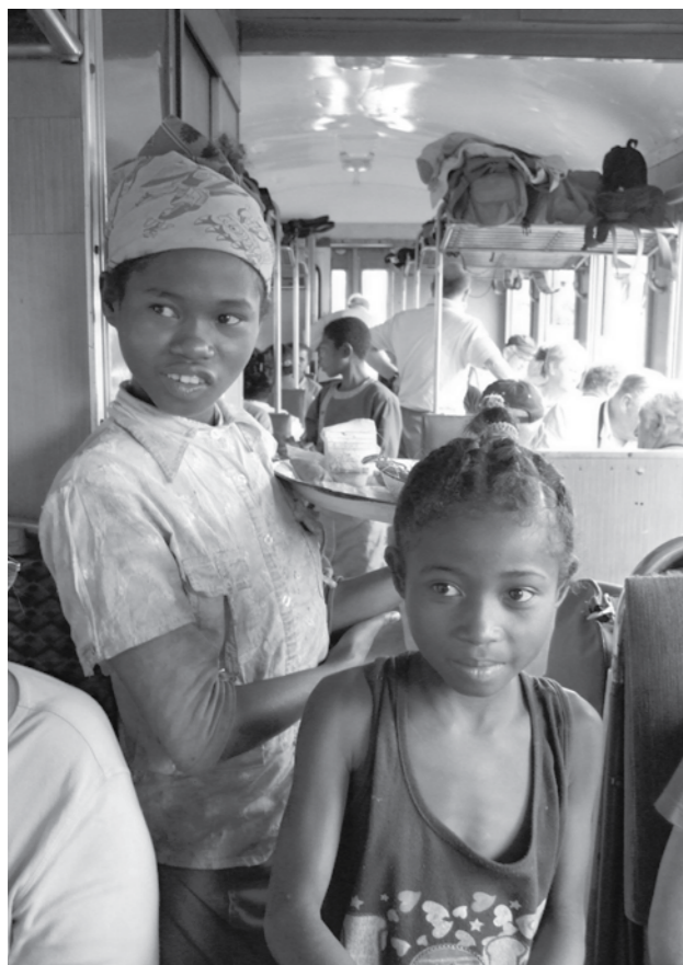
Servering på toget.