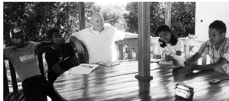
SAMARBEID: Elevane kjem frå skulen Farimbona, som er partnariskule med Tastaveden ungdomskule i Stavanger.