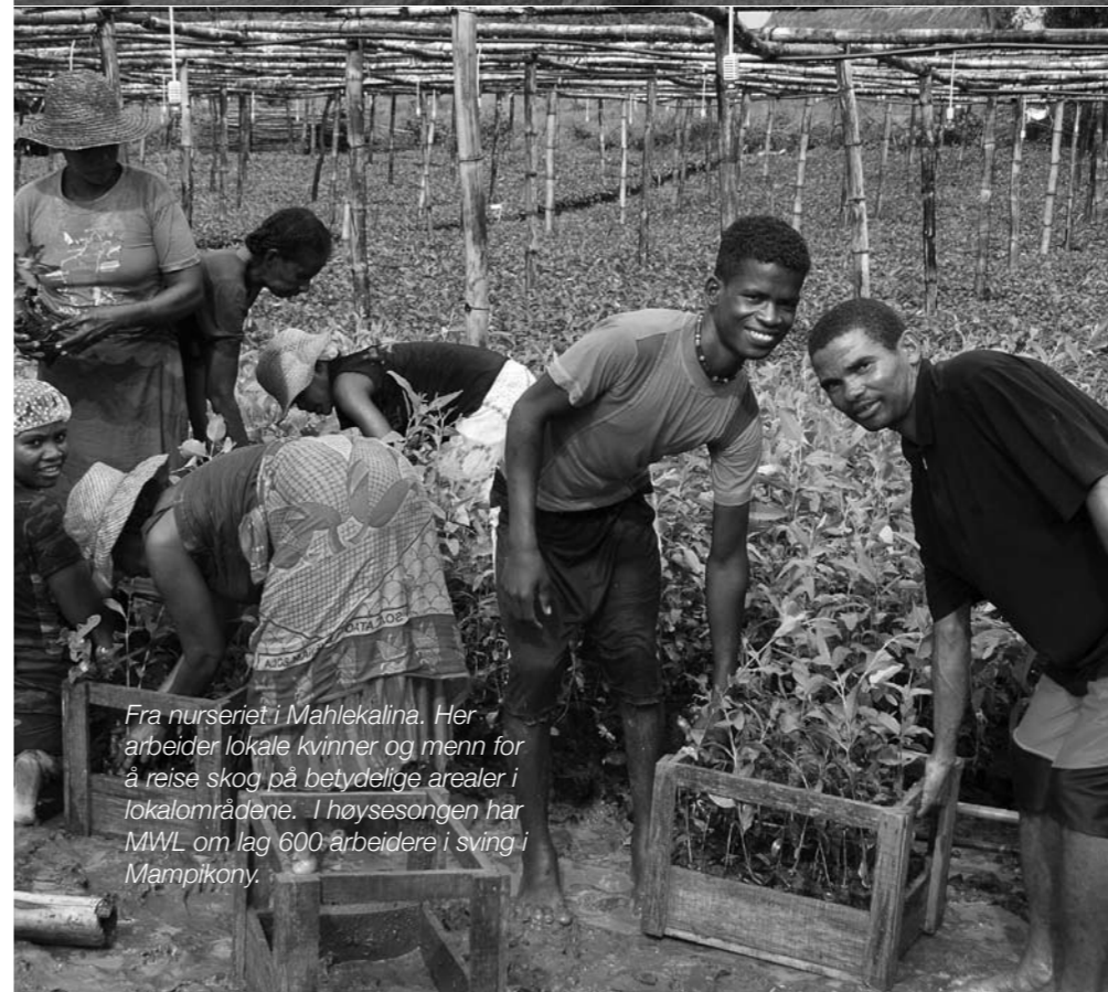
Fra nurseriet i Mahlekalina. Her arbeider lokale kvinner og menn for å reise skog på betydelige arealer i lokalområdene. I høysesongen har MWL om lag 600 arbeidere i sving i Mampikony.