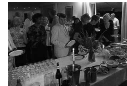
Mottagelse med buffet etter åpningen av LOVASOA. Ambassadøren inviterte både norske og gassiske gjester.