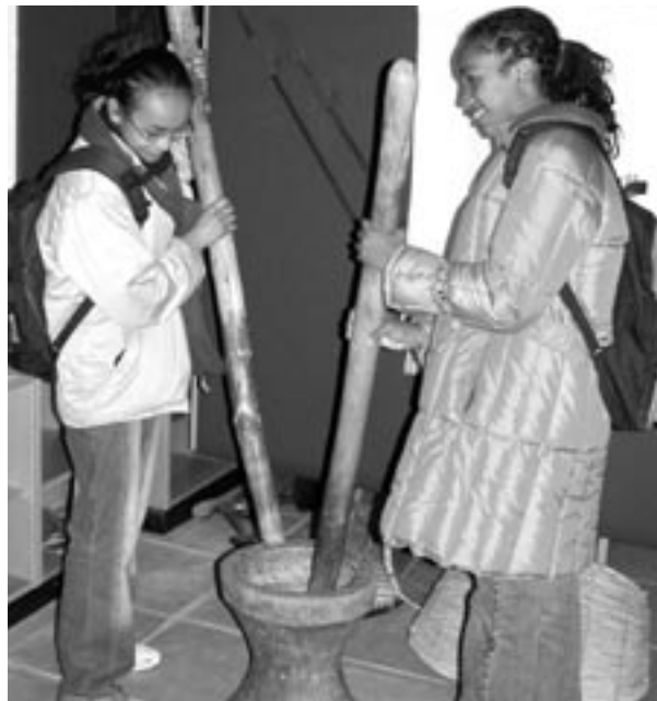
To av elevene i gruppen fra Lycee Andre Resampa, Antsirabe på besøk i Stavanger, oktober 2004. Her prøver de rismorteren i Misjonsmuseet på Misjonshøgskolen.