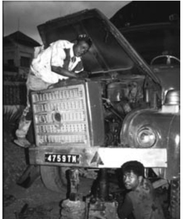
"Reparere – mye viktigere enn kontrollere"

-Dere kan jo forulykke rundt neste sving fordi bilen ikke er i orden; dette kan være livsfarlig! Gendarmen så på oss med ild i blikket mens han nærmest hyttet mot oss med en papirbunke. Gassiske bilpapirer utgjør et lite bibliotek – hvorav det meste står i konstant fare for å gå ut på dato. For eksempel heftet for den tekniske kontrollen.