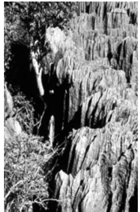
Fjellformasjonene i Tsingyområdet er kjent for sine spisse topper.

Like på nordsiden av Manambolo-elva ligger det som gjerne kalles lille-Tsingy med det karakteristiske piggete fjellet innenfor et relativt lite område. Stedt er godt tilrettelagt for turis-