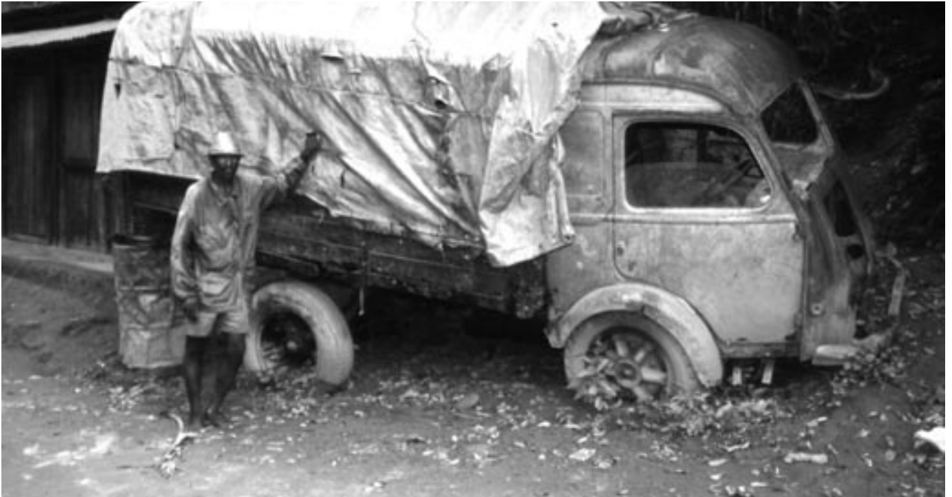
-"Nylig godkjent på 'visite technique'?"

vognkort før det ble overrakt veipolitiet for kontroll; det stanset alle spørsmål og åpnet alle sperrer. Men nå? Den gang ei.