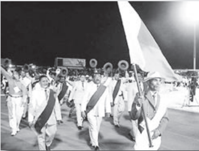
PÅ MAURITIUS: Den gassiske delegasjonen under åpningsseremonien i 2003.

Madagaskarforum følger JIOI 2007: Vet du noe om utviklingen i denne saken? Tips Madagaskarforum: ilinn@frisurf.no