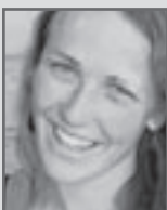
VÅR KORRESPONDENT I TRONDHEIM