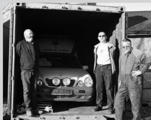
Ambulansen på plass i containeren