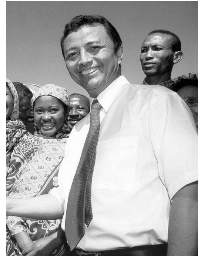
Eks-president Marc Ravalomanana.

Ved alle valg og folkeavstemninger blir valgprosessen styrt av sentralmakten. Valglovene har hittil vært slik at det