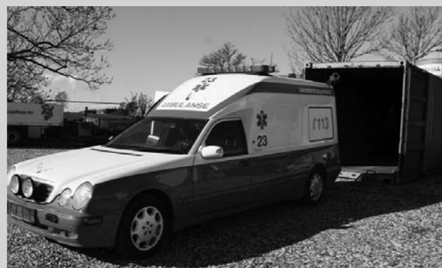
Ambulansen klar for innrygging i containeren