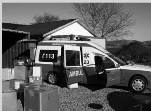
Ambulansen + utstyr klar for pakking