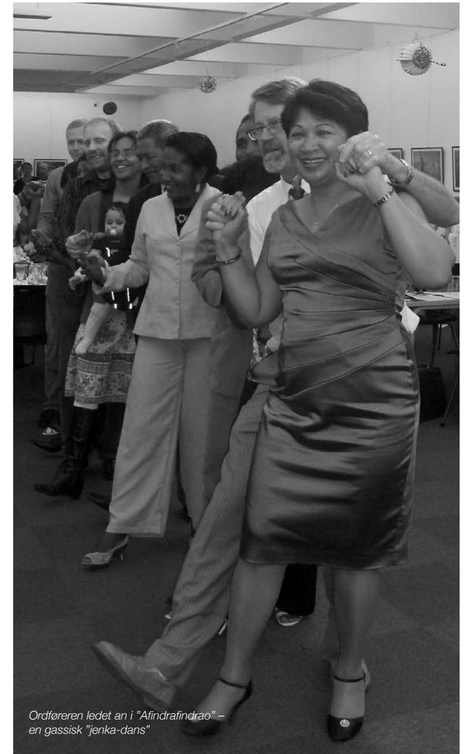
Ordføreren ledet an i "Afindraindrao" – en gassisk "jenka-dans"