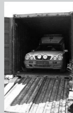
Klar for å kjøres ut av containeren