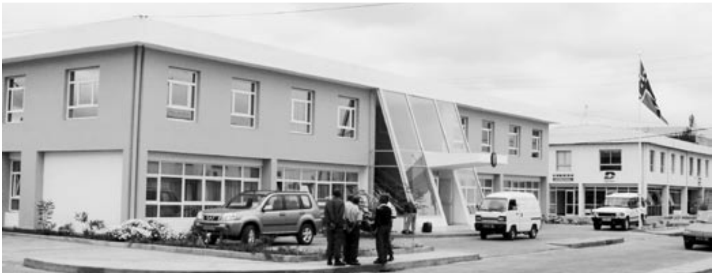
AMBASSADEBYGNINGEN PÅ ÅPNINGSDAGEN: Legg merke til det norske splittflagget og riksvåpenet over inngangspartiet. Ambassaden disponerer hele annen etasje.