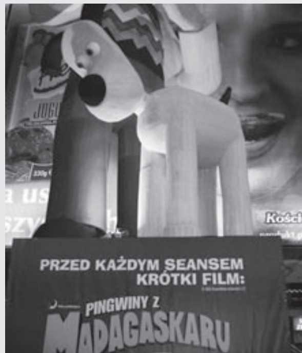
Reklame for Madagascar-filmen i Warszawa, oktober 2005.

Denne filmen minnet meg ikke mye om det ekte Madagaskar, selv om filmskaperne hadde fått med seg en del av de typiske tingene ved landet; lemurer, baobaber (store trær) og fosaene. Siden filmen het Madagaskar, hadde jeg store forventninger, men ble litt skuffet fordi det er langt igjen til det Madagaskar jeg kjenner. Filmen er veldig underholdende og jeg lo godt flere ganger. Mine favoritter var pingvinene, som tror de er spioner. Det var kul musikk og mange gode vits-er. Jeg anbefaler denne filmen for alle, og den passer godt til alle aldere. Og jeg tror at folk som ikke har vært på Madagaskar vil like den bedre enn meg. Terning kast: 4 (+).