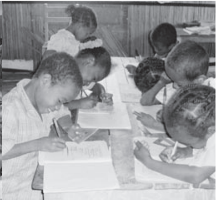
Her er blyantene spisset før elevene jobber med kladdebøkene.