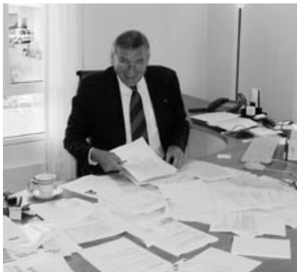
Slik ser det ut på en ambassadørs skrivebord!

– Ratsiraka visavis Ravalomanana, hva er ditt inntrykk av folks mening om presidentskiftet?