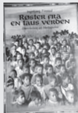
SPENNENDE OG LÆRERIKT: Denne boken burde leses av alle med interesse for Madagaskar.

– Døvekirkene i Norge har fortsatt en misjonskomite som jobber for vedlikehold av døveskolene og for døveprestene på Madagaskar, forteller forfatteren av boka ”Røster fra en taus verden”, som i en alder av 81 år fortsatt er sterkt engasjert i døvearbeidet på Madagaskar.