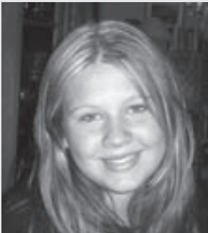
AV JULIE NORDANGER (BILDET)

Anmelderen har tilbrakt syv av sitt 15 år lange liv på Madagaskar. Hun anmelder den nye tegnefilmen for Ny Horisont