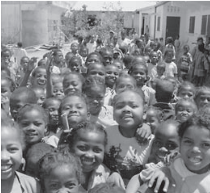
Skolebarn på Østkysten