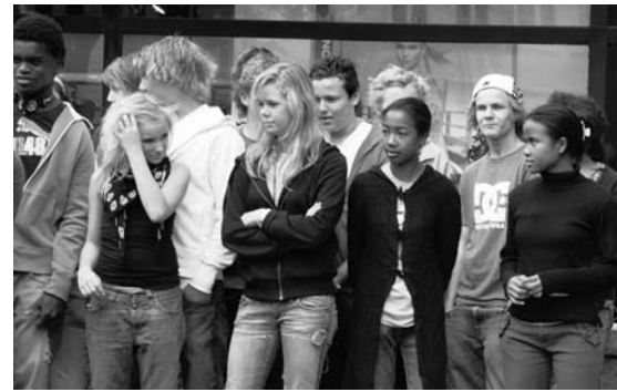
På besøk på Tastaveden skole.

- I juni 2007 fikk vi gjenbesøk fra Farimbona. Rektor og to elever var hos oss ca. én uke. De var med på Ver-