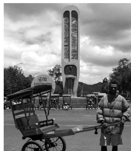
Pousse-poussearbeider i Antsirabe.