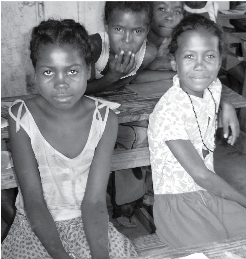
Ofta dropper jentene tidligere ut av skolen enn guttene, ettersom det forventes av de tar del i husarbeidet og likevel "kun" skal bli husmødre.

Norads oppgave er å være faglig rådgiver til Utenriksdepartementet og den norske ambassaden ved behov. En stor del av oppgavene til Norad er relatert til skole og utdanning. Norge er ved siden av Frankrike den viktigste bilaterale givene. Utdanningssektoren utgjør ca 70 prosent av all norsk bistand til Madagaskar. NGOer, det vil si frivillige organisasjoner, disponerer 4,3 millioner (2006). De norske misjonsselskap (NMS) og Fiangonana Loterana Malagasy (FLM) disponerer 30 millioner kr i perioden 2007-2011 for å arbeide med Pro Vert; et "grønt"/miljøvennlig undervisningsprogram gjennom Den lutherske kirken.