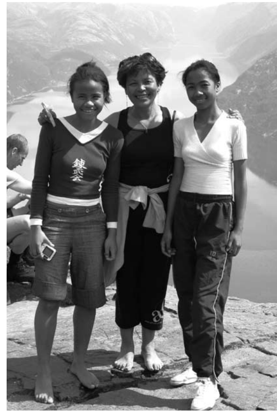
Gjestene ble tatt med opp på Prekestolen.