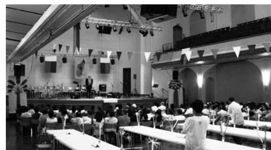
"Feiring av den gassiske nasjonaldagen"