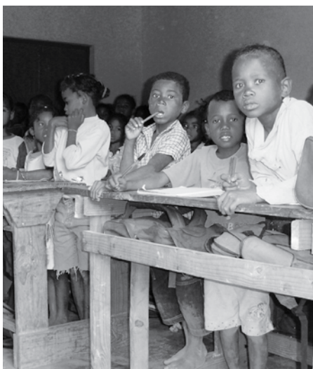
Den gassiske skolen lider fortsatt under etterlevningene etter kolonitiden.

- Det er gasserne som skal kjenne eierskap til utdanningsprogrammet. Givene skal bare bidra på deres premisser der myndighetene ber om det. Det er viktig at givere til utdanningssystemet kjenner sin plass og bidrar til å harmonisere og forenkle prosedyrer rundt bistanden, presiserer Meisfjord.